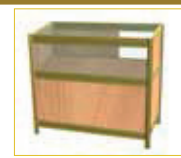
Mostrador vitrina Showcase counter (100 x 50 x 90 cm.) 150,00 €