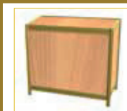
Mostrador Counter (100 x 50 x 90 cm.) 105,00 €