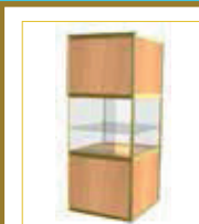
(1x1 m.) Con balda / With self (100 x 100 x 230 cm.) 235,00 €