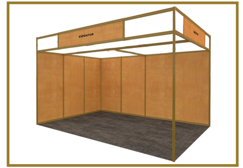
Imagen orientativa. Stand abierto a pasillos. Stand example. Open to aisles.