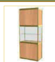
(1x0,5 m.) Con balda / With self (100 x 50 x 230 cm.) 172,00 €