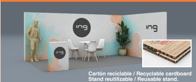
Cartón reciclable / Recyclable cardboard Stand reutilizable / Reusable stand.

Desde: 105 €/m 2 Estructuras impresas personalizadas. Moqueta, iluminación general, Cuadro eléctrico. Mostrador personalizado. 1 Mesa, 3 Sillas de diseño