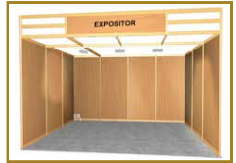
Imagen orientativa. Stand abierto a pasillos. Stand example. Open to aisles.

Grey carpet with plastic protection. Beech colour pannels. Aluminium structure. Grid ceiling (2 x 2 m.) General stand lighting. Spotlights 300 W. in electric carril (50 W/m 2 ) Electrical connection with magnetothermal switch and differential with socket 200 W. - 220 V. Fascia with the exhibitor's name. (Excluded logos) Useful inner height: 2,35 m.